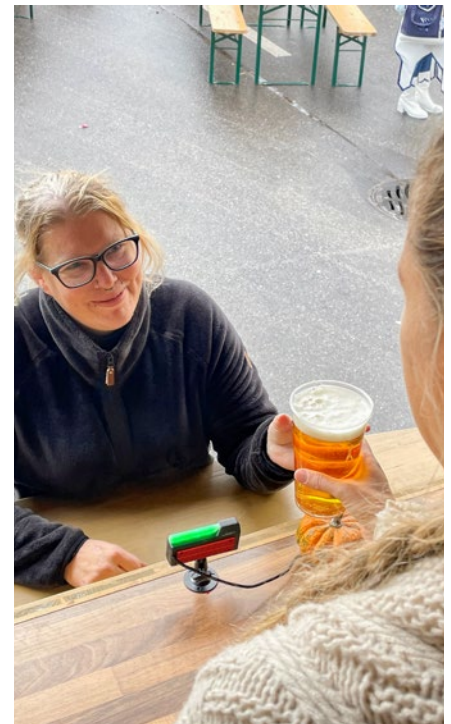
MyCheckrMini bestätigt: Die Kundin bzw. der Kunde ist volljährig – das Gerät zeigt grün an, der Verkauf kann direkt erfolgen.

Die KI schätzt das Alter deutlich zuverlässiger als wir Menschen – besonders in Situationen, in denen ein junges Mädchen älter geschminkt ist oder ein junger Mann mit Kapuze älter wirkt, als er ist.