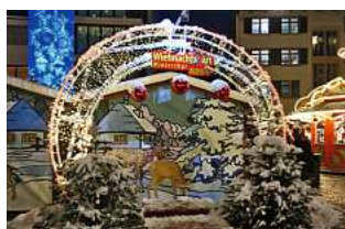
Bedeutung von Weihnachtsmärkten