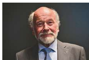
Gratulationen und Infos