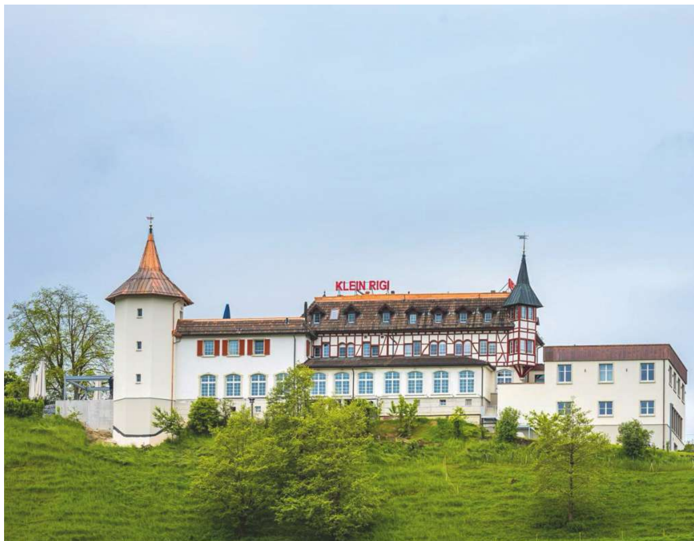
Das Hotel Kleinrigi in Kradolf/Schönenberg ist einen Besuch wert.