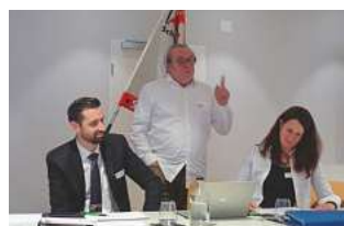
HV der Sektion Nordwestschweiz