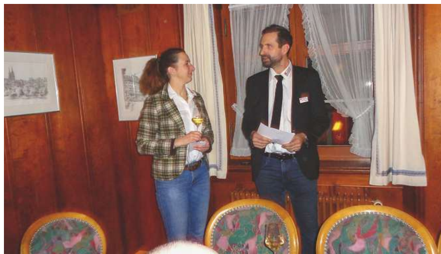
Die Sektion Nordwestschweiz beehrt Reigoldswil.