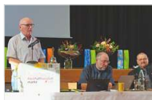
HV der Sektion Ostschweiz